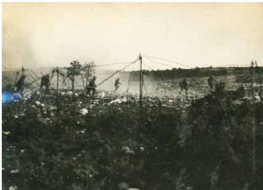
Jurišniki v napadu na Krasu

Napad je bil načrtovan v treh fazah. V prvi bi prišlo do topniškega obstreljevanja na fronti med Tolminom in morjem, ki bi mu sledil napad enot goriške cone na bastione med Plavami in Gorico: od Kuka (611 m) prek Vodice (652 m), Svete gore (681 m) do Škabrijela (646 m) ter na višavje vzhodno od Gorice. General Luigi Cadorna je tudi predvideval, da bodo enote goriške cone med Bodrežem in Logo ustvarile na levem bregu Soče novo mostišče. Z obema fazama so Italijani želeli, da bi Svetozar Borojević poslal del enot s Krasa in tam oslabil svoje obrambne položaje. Šele potem bi sledil glavni napad tretje italijanske armade med reko Vipavo in morjem, s ciljem priti v Trst.