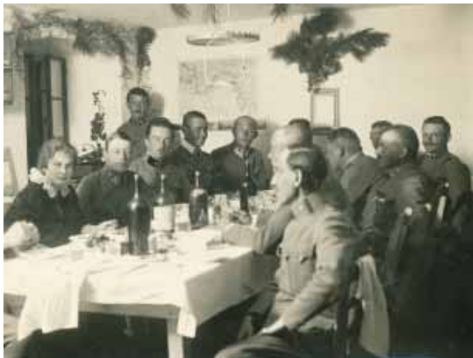
Skupina avstro-ogrskih častnikov za mizo na Krasu, fototeka Vojaškega muzeja SV